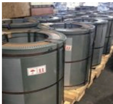
外装用鋼板 / Metal jacket for protecting exterior pipeline and thermal insulation material in petrochemical plant