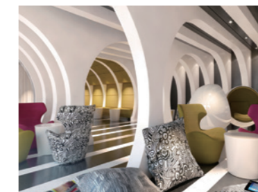
内装材 / Interior decorative materials