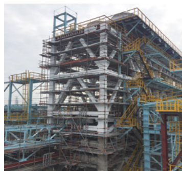
耐火被覆材（鉄骨柱、梁等） / Fireproof cladding (steel column, steel beam, etc.) in petrochemical plant