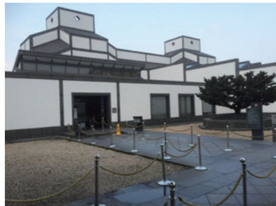
博物館・美術館用調湿建材（壁材・天井材） / Fireproof humidity controlling materials for museum and galleries (wall, ceiling)