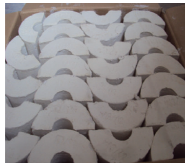
高性能けい酸カルシウム保温材 / High-performance calcium silicate thermal insulation materials