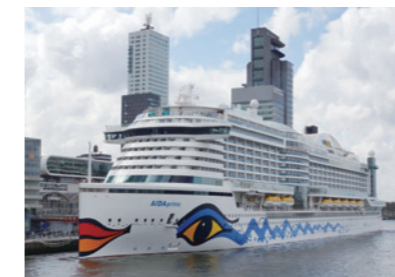
客船イメージ / The latest cruise ship which include materials we supplied