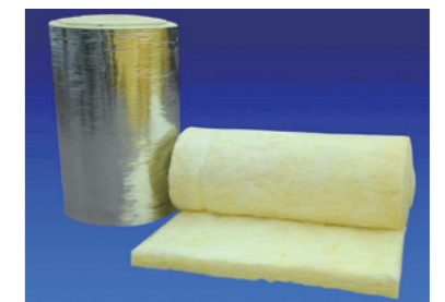
騒音規制対応不燃防熱材 / Noncombustible thermal insulation material which complies with the latest IMO noise reduction regulation